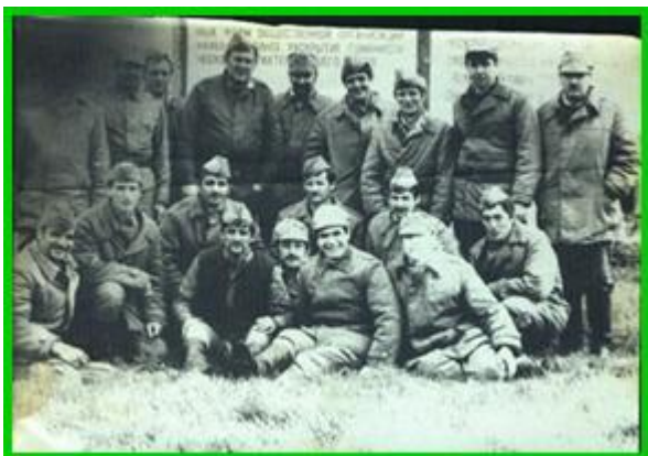
Ликвидаторы последствий аварии на Чернобыльской АЭС, которые спасли Европу от облучения, Украину и Беларусь – от уничтожения.

Сельскохозяйственные угодья площадью почти 52 тысячи кв. км подверглись загрязнению цезием-137 и стронцием-90 с периодом полураспада в 30 и 28 лет , соответственно. Более 400 тысяч человек были переселены, однако, миллионы по-прежнему живут в условиях, когда сохраняющееся остаточное воздействие создает целый ряд опасных последствий для их жизни и здоровья.